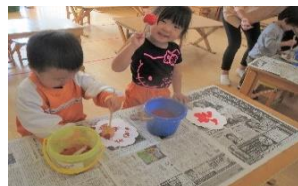
にこにこ:紅葉の色をつけたよ!