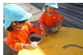
すくすく:どんぐりを使っておまごごをしたよ!