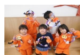
るんるん:ハロウィンリース完成!