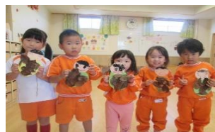
のびのび:落ち葉でみのむしを作ったよ!