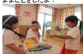
すいすい:秋まつりごっこをしたよ!