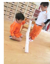
わくわく:どんぐりころがしをしたよ!